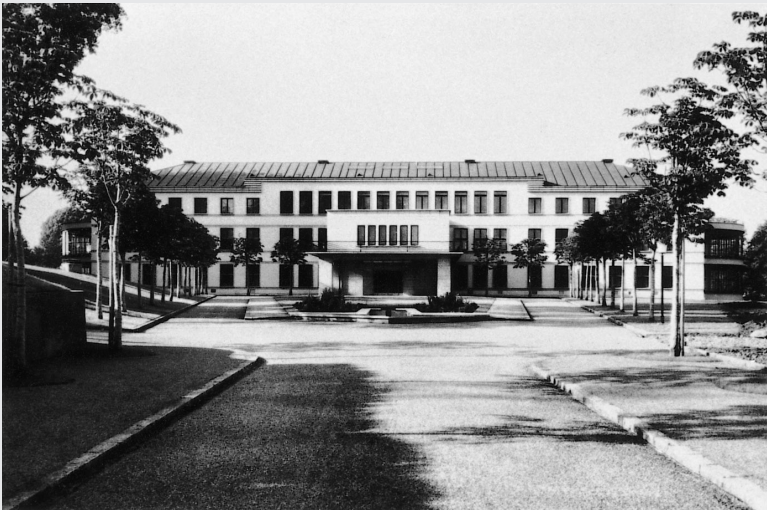
Ansicht von Norden