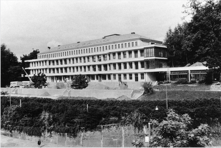
Ansicht von Süden