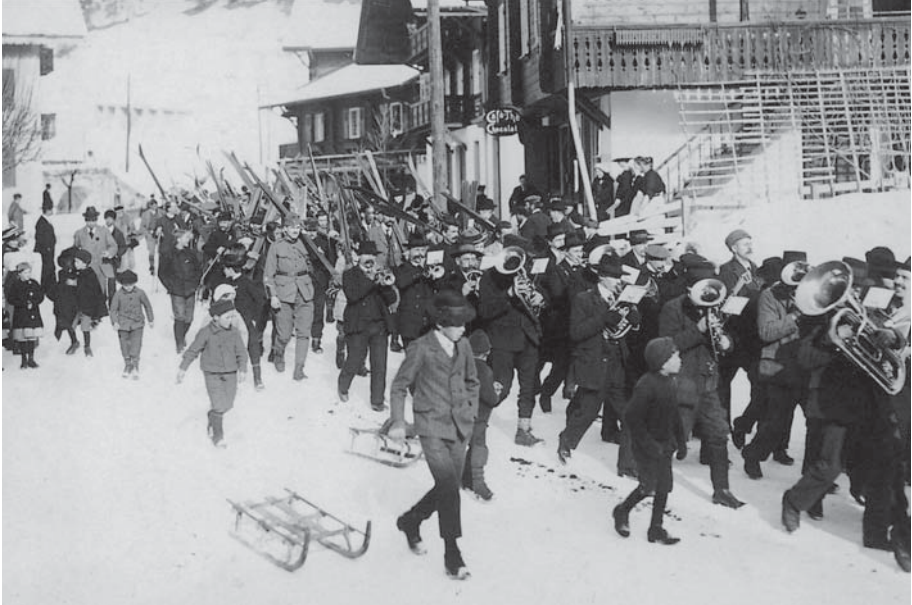
Abb. 6 Umzug beim Grossen Schweizerischen Skirennen von 1917 in Gstaad. Mit dieser Veranstaltung versuchte der Kurort, den Wintersport während der Krise des Ersten Weltkrieges anzukurbeln. Bilder wie dieses aus einer privaten Sammlung bilden einen reichen Quellenfundus für Ortsgeschichten.

Ortsgeschichten basieren auch auf privatem Quellenmaterial wie zum Beispiel Vereinsarchiven. Für die jüngste Geschichte sind ausserdem Erinnerungen von Zeitgenossen wichtige Quellen. Innerhalb der Geschichtswissenschaft hat sich in den letzten Jahrzehnten die so genannte Oral History als Methode etabliert, mit der Zeitzeugen systematisch befragt werden. Es gibt jedoch nur wenige Gemeinden, die ältere Einwohnerinnen und Einwohner interviewen liessen und diese Quellen zur Alltagsgeschichte auch archiviert haben. In der Arbeit über Münchenbuchsee sind 54 Interviews transkribiert und publiziert worden. Die Gemeinde Ostermundigen hat Mitte der 1990er-Jahre durch das Geschichtsatelier Interviews durchführen lassen. Diese lagern seither als Tondokumente im Gemeindearchiv, ohne dass sie für die neuste Ortsgeschichte verwendet wurden. 67