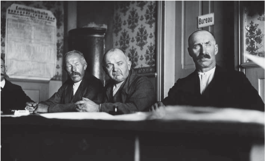
Abb. 5 Gemeinderatssitzung in Rüderswil 1938. Die Politik ist ein eigentliches Tabuthema in Ortsgeschichten.

neben Kurzporträts der Parteien einen kurzen Überblick über das politische Geschehen im 20. Jahrhundert. 61