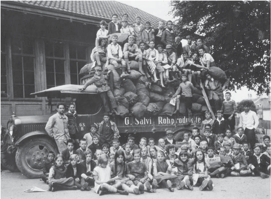
Abb. 4 Schülerinnen und Schüler des Primarschulhauses Friedbühl in Bern posieren während einer Papiersammlung in den 1930er-Jahren für den Fotografen. Das Thema Schule gehört zum Pflichtprogramm in jeder Ortsgeschichte, da das Schulwesen zu den zentralen Aufgaben einer Gemeinde zählt.

Das Zielpublikum der Ortsgeschichten sind primär die erwachsene Wohnbevölkerung und allenfalls ausgewanderte Gemeindegewohnerinnen und -bürger. Ferner kommen die Publikationen im Schulunterricht zum Einsatz. In Ausnahmefällen ist die Historikergewerkschaft eine wichtige Adressatin. Dies trifft besonders bei den Publikationen zur Stadt Bern zu. Andere Beispiele sind die Dissertation von Ueli Haefeli, der die Geschichte von Münchenbuchsee seit 1945 untersucht hat, und die Lizentiatsarbeiten von Alfred Kuert über Langenthal sowie von Gabriela Neuhaus über Nidau. 58