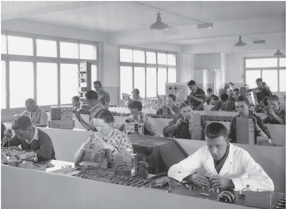
Abb. 7 Kleinmontageraum der Firma Hasler im Liebelfeld 1942. Grosse Firmen vermögen die Entwicklung von Gemeinden oder Quartieren mitzuprägen. Deshalb sind ihnen oft einzelne Kapitel in Ortsgeschichten gewidmet.

In jüngster Zeit bietet sich das Internet als Kommunikationsplattform für Ortsgeschichtsprojekte an. Die im Herbst 2004 publizierte Ortsgeschichte Worb war seit dem Projektstart 1999 im Internet präsent. Die Webseite, die auch über die Internetseite der Gemeinde zugänglich ist, enthält