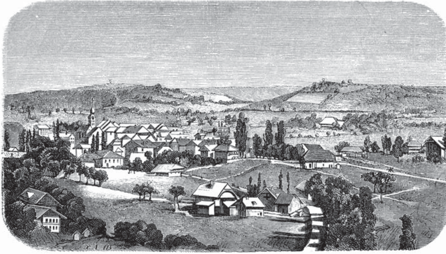
Abb. 1 Die im 19. Jahrhundert publizierten Ortsgeschichten enthielten kaum Illustrationen. Die wenigen Abbildungen waren noch nicht Fotografien, sondern Kupferstiche oder Lithografien, wie in diesem Beispiel aus Huttwil von 1871.

(1958), «Langenthaler Heimatblätter» (1961), «Saaner Jahrbuch» (1971), «Eisser Chronik» (1973), «Lysser Neujahrsblätter» (1976), «Erlacher Städtchenchronik» (1980) sowie «Nidauer Chlouserblätter» (1990). Im Umfeld des Historischen Vereins des Kantons Bern existierten ab dem 19. Jahrhundert Zeitschriften, welche das ganze Kantonsgebiet abdeckten. Ludwig Lauterburg (1817–1864), einer der vier Gründer des Vereins, gab 1852 das erste «Berner Taschenbuch» heraus. Er betreute dieses Jahrbuch als Redaktor bis zu seinem Tod. Danach erschien es unter wechselnder Leitung weiter bis 1934 – ab 1896 herausgegeben von Heinrich Türler (1861–1933). Neben Aufsätzen zur bernischen Geschichte im weitesten Sinn umfasste es jährlich eine Chronologie wichtiger Ereignisse im Kanton Bern. 18 Im «Hinkenden Boten» publizierte der Pfarrer Karl Hermann Kasser (1847–1906) ab 1887 zahlreiche Aufsätze unter der Rubrik «Das Bernbiet ehemals und heute». 19