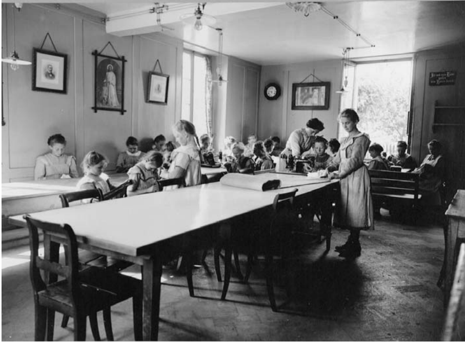
Abb. 3 Mit Stolz präsentierte der Kanton Bern an der Landesausstellung von 1914 seine Armeninstitutionen, darunter auch die Armenerziehungsanstalt für Mädchen Steinhölzli in Bern. Allerdings war die Zahl der Kinder, die in solchen Heimen lebten, relativ gering im Vergleich zu jenen, die in Pflegefamilien untergebracht wurden.

durch Naturalien und, seltener, auch durch Bargeld aus der städtischen Armenkasse unterstützt wurden. Zweitens die Verkostgeldung, das heisst die Unterbringung der verarmten Personen in einem fremden Haushalt, wobei die Armenkasse die Pflegefamilie für die Unterbringung, Pflege und Ernährung des Kostgängers oder der Kostgängerin bezahlte. Drittens die Anstaltspflege, die Unterbringung der Armen in einem Heim oder einer Armenanstalt.