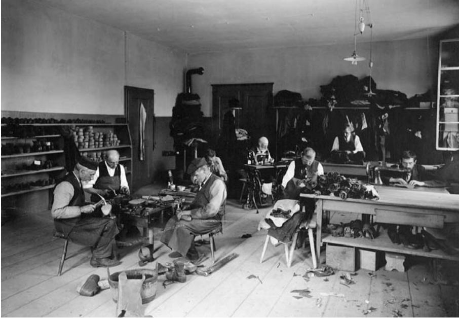
Abb. 5 Das Schusteratelier der Männer in der städtischen Armenanstalt Kühlewil. Das Bild wurde ebenfalls für die Landesausstellung von 1914 gemacht. Die männlichen Insassen mussten in der Landwirtschaft und in den Werkstätten der Anstalt mitarbeiten.

Im Februar 1887 reichten der Grütliverein, die Arbeiterpartei und der allgemeine Arbeiterverein im Berner Stadtparlament eine Petition ein, in der sie die Schaffung einer unentgeltlichen öffentlichen Arbeitsvermittlungsstelle forderten. An sie sollten sich arbeitslos gewordene Männer und Frauen wenden können, um rascher wieder eine Stelle zu finden. Der Grosse Stadtrat setzte eine Kommission ein, die das Anliegen prüfte. In einem umfassenden Bericht, in dem sie nicht nur die Situation auf dem bernischen Arbeitsmarkt analysierte, sondern auch über Erfahrungen mit Arbeitsvermittlungsstellen in anderen Städten im In- und Ausland berichtete, befürwortete die Kommission die Schaffung einer städtischen Stelle für Arbeitsvermittlung und legte einen entsprechenden Vorschlag vor, den der Gemeinde- und der Stadtrat guthiessen. Zu Beginn des Jahres 1889 nahm die Anstalt für Arbeitsnachweis den Betrieb auf. Der Erfolg der neuen Einrichtung hielt sich anfänglich in engen Grenzen. Die Arbeitssuchenden nahmen dieses Angebot nur zögernd in Anspruch, und die Arbeitgeber bevorzugten die herkömmlichen Wege der Personalrekrutierung. Vor allem bei den Männern war die Vermittlungsquote mit rund einem Viertel der Stellensuchenden zudem nicht sehr hoch, während bei den Frauen auf diesem Weg immerhin etwa drei Viertel eine neue Stellen fanden. Ein Grund für die Startschwierigkeiten der Arbeitsvermittlungsanstalt war wohl auch die Tat-