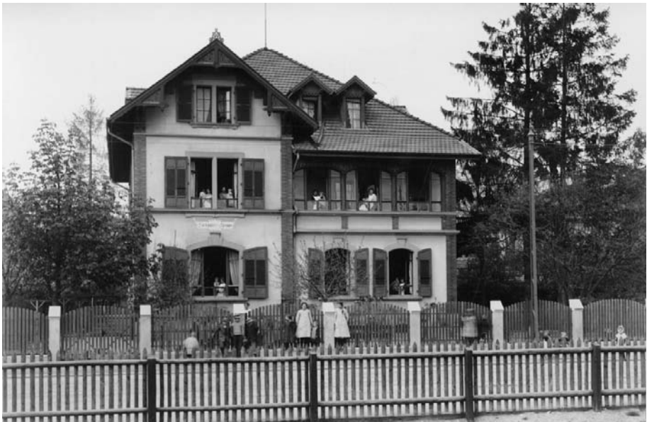
Abb. 7 Die 1880 gegründete Kinderkrippe in der Länggasse wurde ab 1898 durch die Stadt Bern subventioniert. Das vorliegende Bild stammt ebenfalls aus einem Album für die Landesausstellung von 1914.

Das Problem der Kinderbetreuung stellte sich indes nicht nur bei den Schulkindern, die in den Horten beaufsichtigt wurden, sondern mindestens ebenso dringlich bei den Kleinen, für die in den Neunzigerjahren erst vier private Krippen in der Altstadt (seit 1873), in der Lorraine (seit 1874), in der