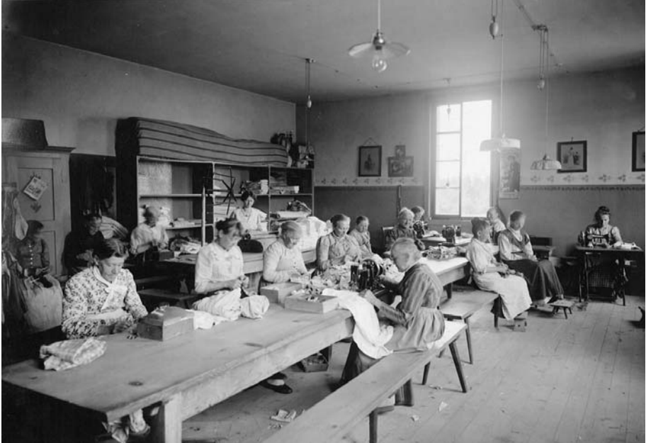
Abb. 4 Armenanstalt Kühlewil auf dem Längenberg 1914: Das Nähatelier war mit modernen Nähmaschinen ausgestattet. Die Frauen waren vor allem hier und in der Hauswirtschaft beschäftigt.

nungsjahr stieg die Zahl der Insassen auf 312 29 und nahm im nächsten Jahrzehnt noch leicht zu, auf rund 350 Personen im Jahr 1902. 30