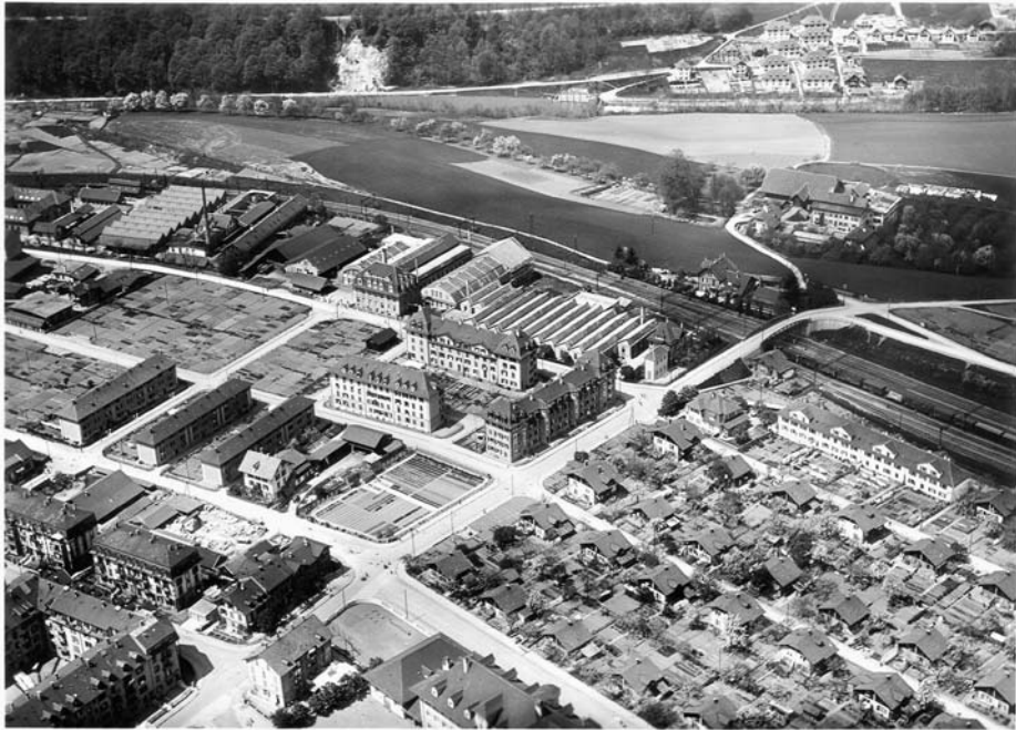
Abb. 6 Die städtische Arbeitersiedlung Wylerfeld, rechts unten im Bild zwischen Standstrasse, Scheibenstrasse und Wylerringstrasse, auf einer Luftaufnahme um 1930. Die Siedlung war ein sehr frühes Beispiel kommunalen sozialen Wohnungsbaus. Die Zweifamilienhäuser mit grossen Gärten mussten ab 1956 grossen Wohnblöcken und dem Quartierzentrum Wylerhuus weichen.