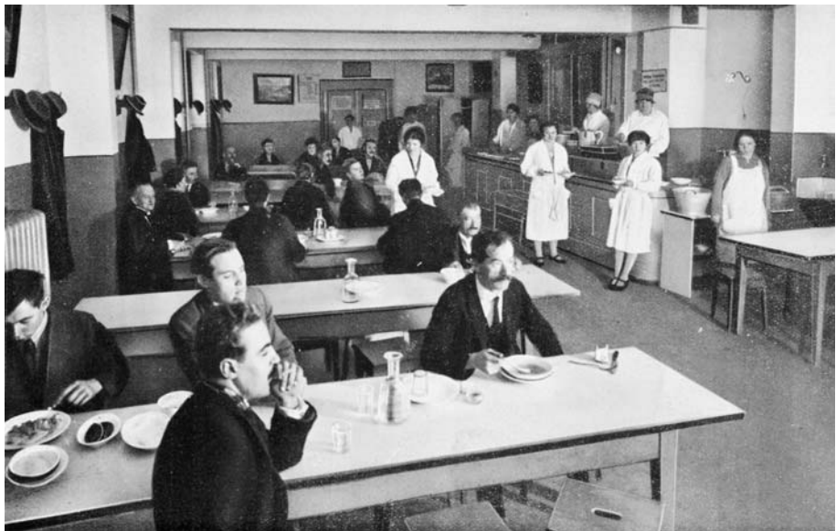
Abb. 2 Angesichts der wachsenden Not in der Stadt Bern entstanden in den 1870er- und 1880er-Jahren auch private Wohltätigkeitsinstitutionen wie die 1877 gegründete Speiseanstalt «Spysi» in der unteren Altstadt, wo den Armen warme Mahlzeiten angeboten wurden. Diese Aufnahme stammt aus dem Jahr 1928.

Auf diese Vorteile der freiwilligen Armenpfleger und -pflegerinnen wollte und konnte man in Bern auch nach 1888 nicht verzichten. Die Ge-