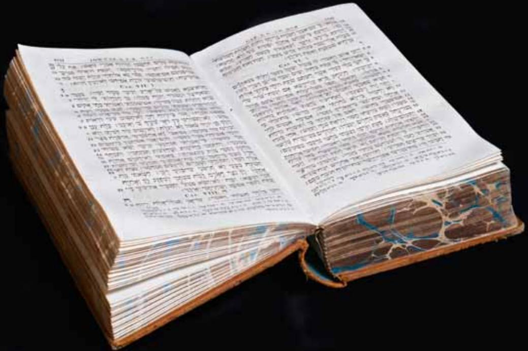
Ankers letzte vor seinem Tod gelesene Buchseite: «Im Alter wirst du zu Grabe kommen, wie die reifen Garben eingefahren werden». Genesis, Hiob, 5.26, hier als Übersetzung des hebräischen Originals.