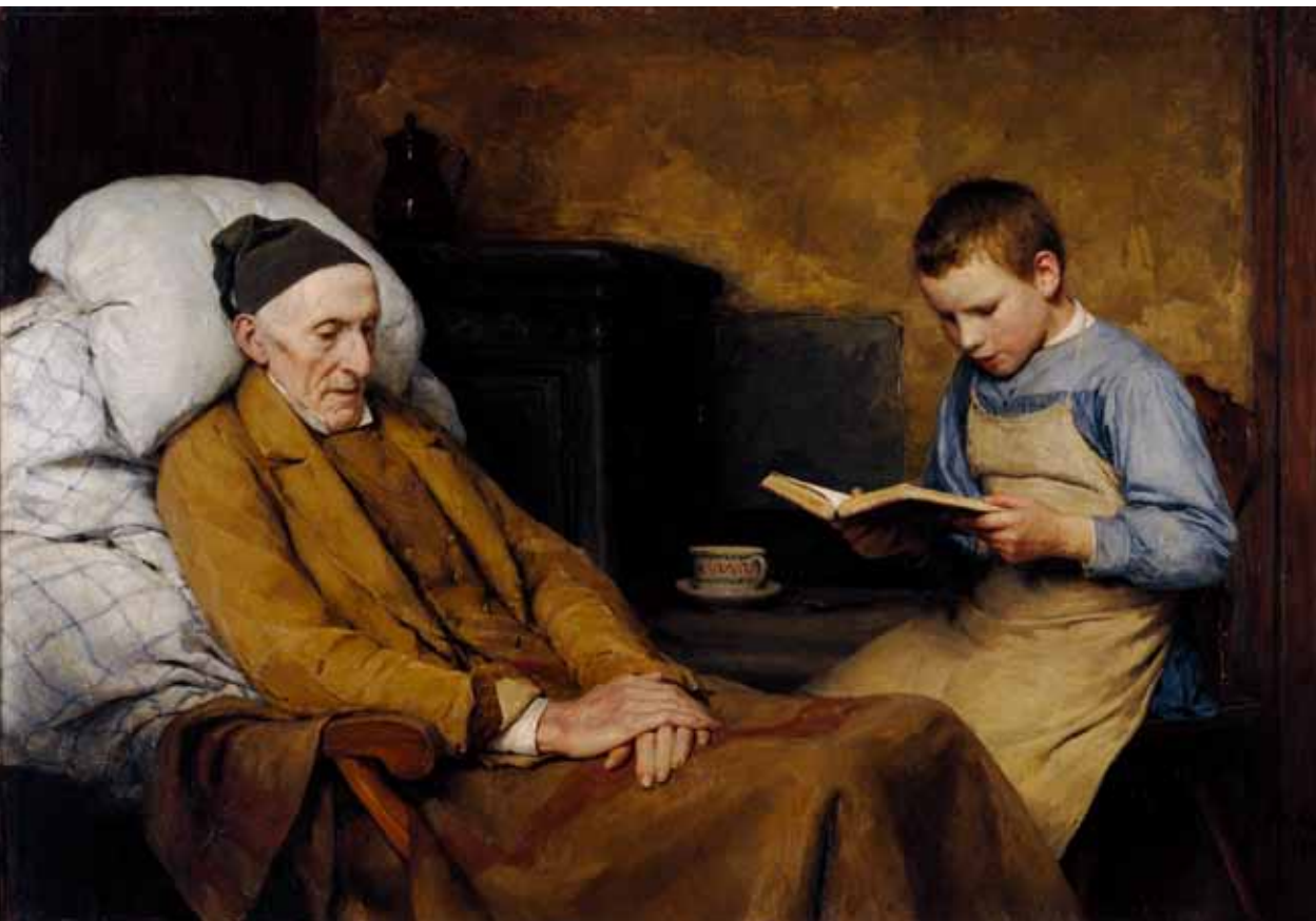
Albert Anker, Die Andacht des Grossvaters , 1893, 63 x 92 cm. Kat. Nr.483. – Kunstmuseum Bern .