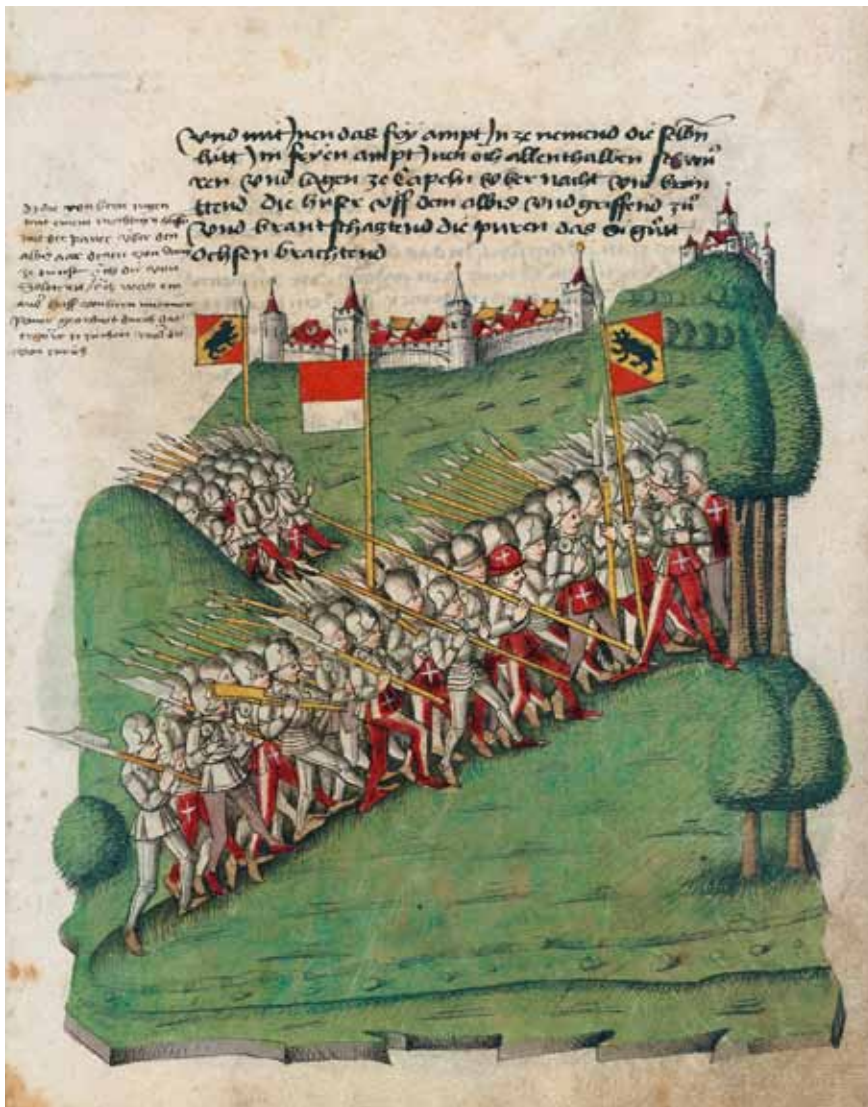
Bern unterstützt im November 1440 Schwyz mit Truppen. Ein Teil der Berner und der verbündeten Solothurner zieht über den Albis zu den Schwyzern, der andere über Mellingen in die Zürcher Landschaft. – Bendicht Tschachtlan : Bilderchronik (um 1470), Zentralbibliothek Zürich, Ms. A 120, S. 699.