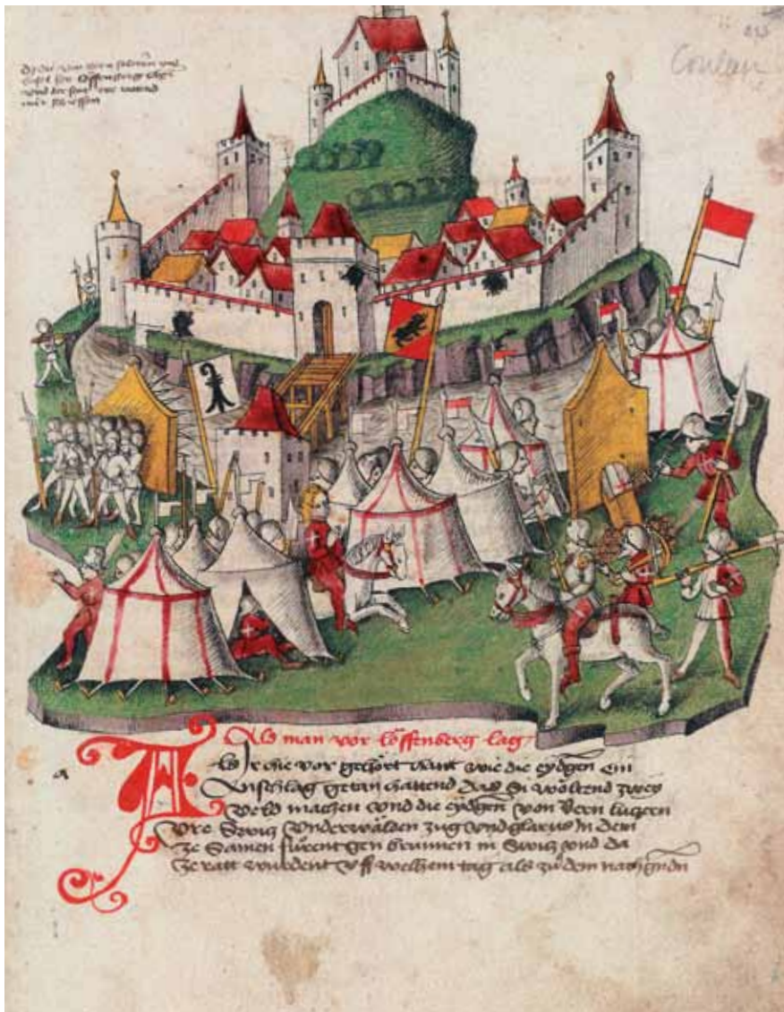
Laufenburg wird im August 1443 von Berner Truppen und Kontingenten aus den verbündeten Städten Basel und Solothurn belagert. – Bendicht Tschachtlan: Bilderchronik (um 1470), Zentralbibliothek Zürich, Ms. A 120, S. 813.