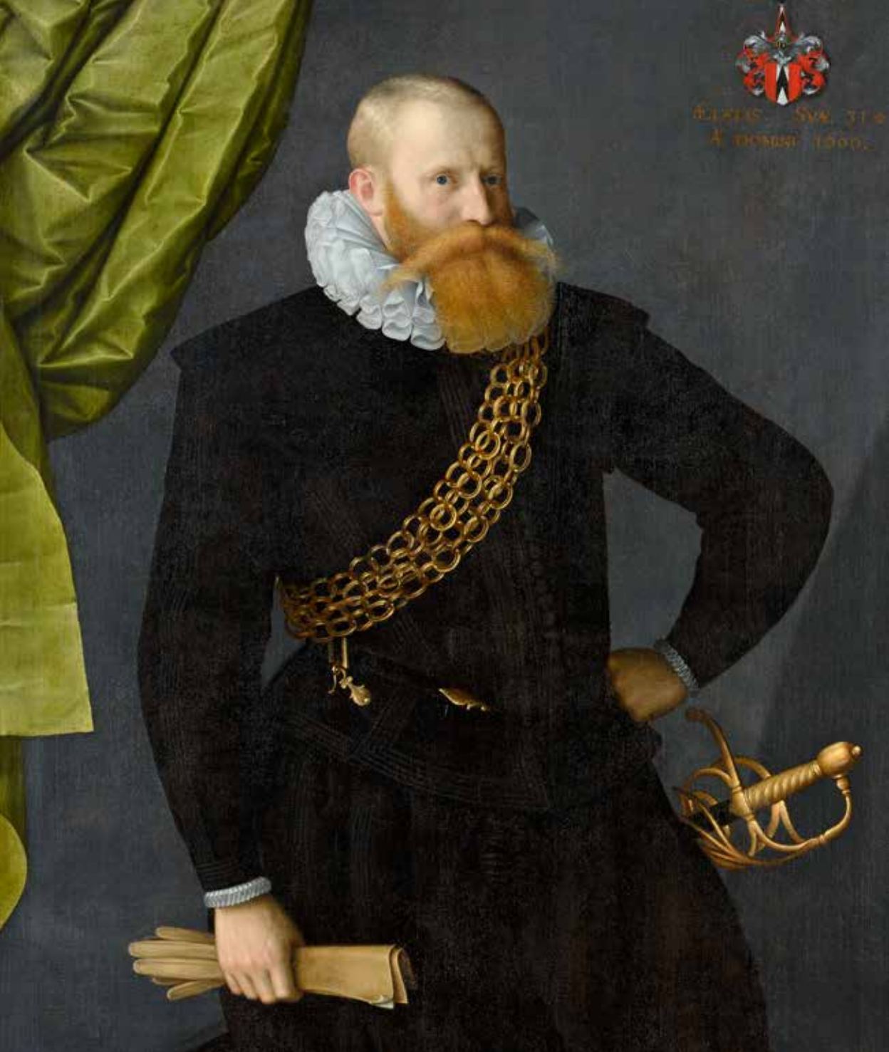
Porträt Franz Ludwig von Erlach (1574–1651) im Alter von 31 Jahren. Mit Ehrenkette und Degen. Rumbolt von dem Holts (Lebensdaten unbekannt), 1606, Öl auf Leinwand, 126,5 x 91,5 cm [Ausschnitt].