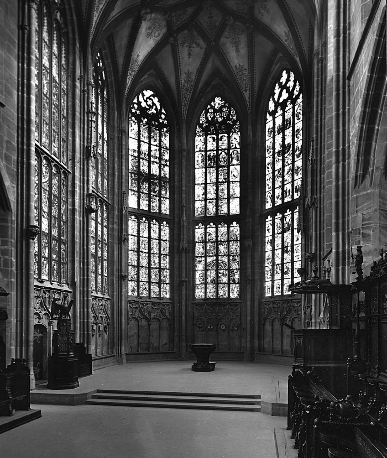
Blick in den Altarraum des Münsters.