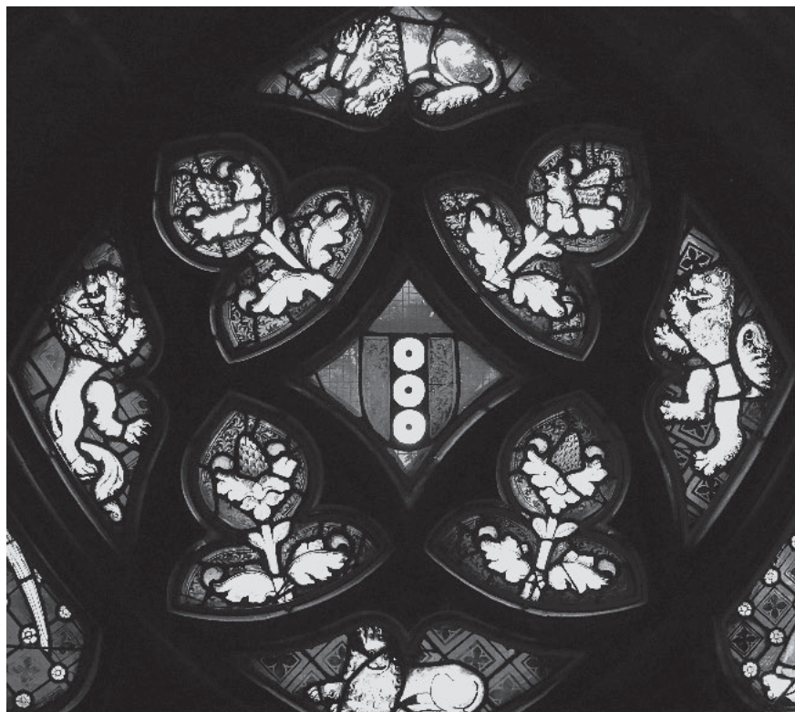
Berner Münster. Ringoltingen-Fenster mit der Dreikönigslegende. Stifterwappen im «Couronnement» des Chorfensters Nord III. – Foto: Richard Némec 2017.