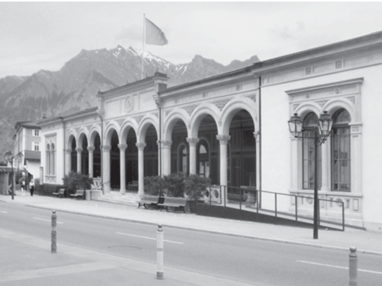
Das 1866/67 errichtete «Dorfbad» in Bad Ragaz ist als einziges traditionelles Badehaus der Schweiz noch bis heute in Betrieb.