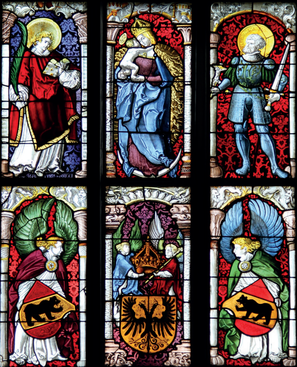
Die von der Stadt Bern gestifteten sechs Glasscheiben. In der oberen Reihe ist die Kirchenpatronin Maria, begleitet von den Stadtheiligen Vinzenz (links) und Achatius (rechts), dargestellt. Darunter flankieren die beiden Standesscheiben das Reichswappen. – Jegenstorf, Chor, Mittelfenster von 1515.